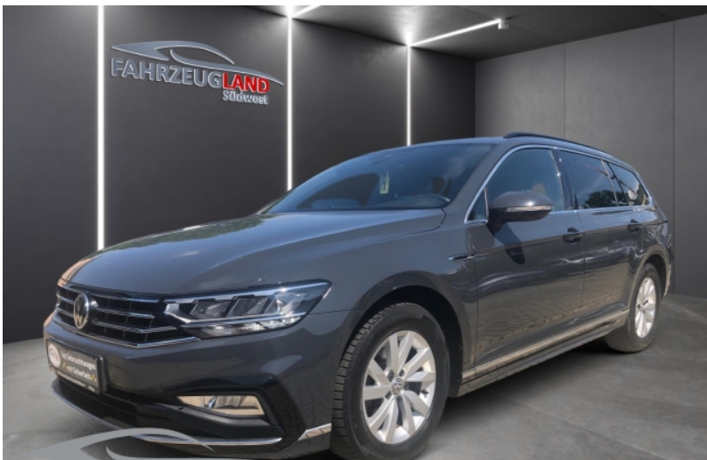
FAHRZEUGLAND Südwest www.fahrzeugland.com Tel.: 07631 - 974740