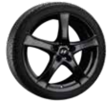
12. F2 schwarz 7,5x18" ET50 5x114,3 999XF02052103