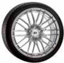
15. CW4 7,5x19" ET51 5x114,3 999XF0206288