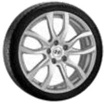
7. Magnit silber 7,5x18" ET49,5 5x114,3 999XF0205278