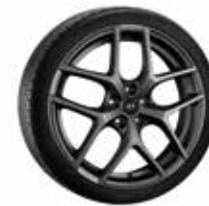
19. Y-Rad grau 8,0x19" ET50 5 5x114,3 999XF0206297