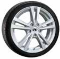
1. HMD01 silber 6,5x16" ET45 5x114,3 999XF02032106 7,0x17" ET47 5x114,3 999XF02042106