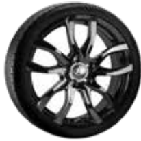
8. Magnit schwarz 7,5x18" ET49,5 5x114,3 999XF0205293