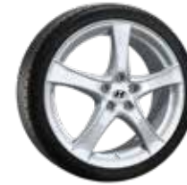
11. F2 silber 7,5x18" ET50 5x114,3 999XF02052102