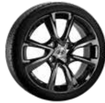
9. Depan Dark 7,5x17" ET46 5x114,3 999XF0204253