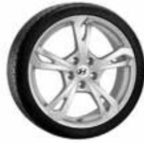
3. Mentari silber 6,5x16" ET45 5x114,3 999XF02032291 7,0x17" ET47 5x114,3 999XF02042291 7,5x18" ET49,5 5x114,3 999XF02052291