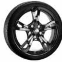
4. Mentari schwarz 6,5x16" ET45 5x114,3 999XF02032292 7,0x17" ET47 5x114,3 999XF02042292 7,5x18" ET49,5 5x114,3 999XF02052292