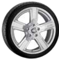
16. Versilia 8,0x19" ET45 5x114,3 999XF0216269