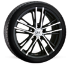
6. Momentum schwarz 7,0x17" ET47 5x114,3 999XF0204242