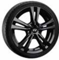
2. HMD01 schwarz 6,5x16" ET45 5x114,3 999XF02032107 7,0x17" ET47 5x114,3 999XF02042107