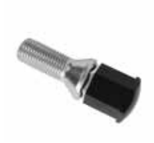
20. Radmutterkappen Schwarz. Set aus 5 Stück. 9999Z010899

Bezüglich zulässiger Reifengrößen berät Sie Ihr Hyundai Servicepartner gerne.