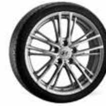
5. Momentum silber 7,0x17" ET47 5x114,3 999XF0204251