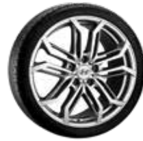
10. Matahari 7,5x18" ET45 5x114,3 999XF0205248