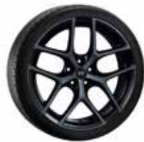
17. Y-Rad schwarz 8,0x19" ET50 5 5x114,3 999XF0206299