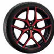
18. Y-Rad rot 8,0x19" ET50 5 5x114,3 999XF0206298