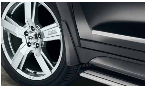
Schmutzfängerset, vorne. Im Look des Tucson design, schützen diese Sätze aus 2 schwarzen Schmutzfängern die anfälligsten Stellen Ihres Autos vor Schäden durch Steine, Schneematsch, Dreck, Schutt und Streusalz. D3F46-AK000

Der neue Tucson zieht alle Blicke auf sich. Hochwertiges Originalzubehör rundet den Eindruck von echtem Premium Design stilsicher ab.