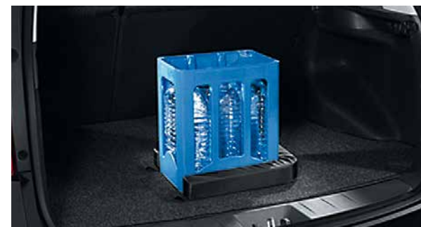
Orderly®. Für gesicherte Verhältnisse, absolut flexibles Kunststoffpolster, unverrückbare Fixierung (mittels Klettband), schützt und sichert jeden Gegenstand vor dem Verrutschen, Lieferung in Schwarz. 9999S-03007