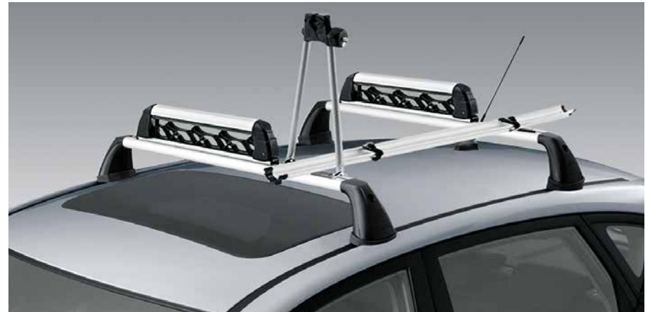
Ski- und Snowboardträger. Paar, Aluminium, für 4 Paar Ski oder 2 Snowboards, abschließbar, zur Montage auf allen Relingquerträgern aus unserem Programm. 9999Z-04032