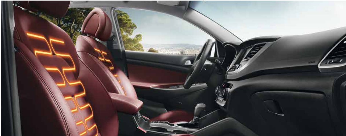
Sitzheizung. Zweistufig schaltbar mit jeweils 50 W Heizleistung für Fahrer- und Beifahrerseite. Passgenaue Heizmatten für Sitz- und Rückenfläche. 9999Z-060120