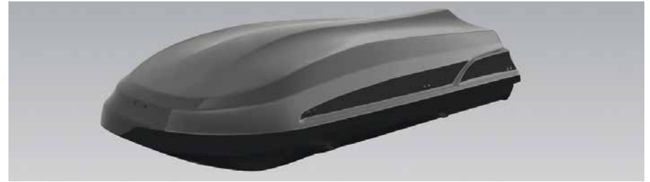
Dachbox „Adamantis“. Volumen: 460 Liter, Maße: 185 x 80 x 42 cm, Farbe: anthrazit, doppelseitig öffnend. 9999Z-04197