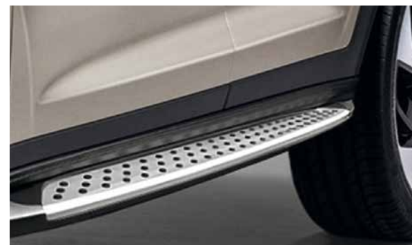
Trittbretter "sportlich". Sportlich und funktional, in matter Aluminiumoptik mit rutschfesten Gummieinlagen, erleichtern sie den Zugang zu Innenraum, Kabine und Dachzubehör. Nicht in Verbindung mit Schmutzfängern. 9999Z-05426