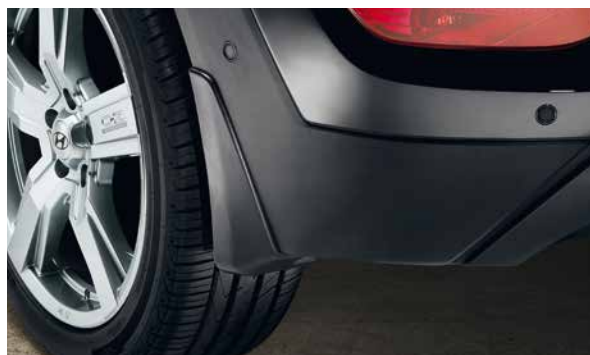
Schmutzfängerset, hinten. Im Look des Tucson design, schützen diese Sätze aus 2 schwarzen Schmutzfängern die anfälligsten Stellen Ihres Autos vor Schäden durch Steine, Schneematsch, Dreck, Schutt und Streusalz. D3F46-AK100