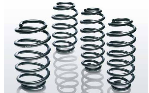
Tieferlegungssätze. Absenkung ca. 25 mm vorne und hinten

1,6 GDI 2,0 CRDi 1,6 T-GDI 9999Z-05358 1,7 CRDi 9999Z-05357