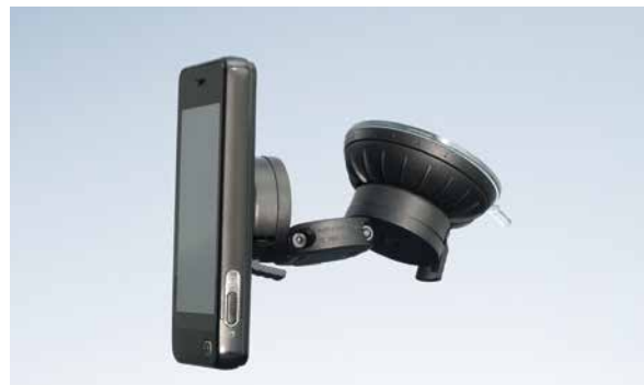
Handyhalterung. Gut aufgehoben und in Sichtweite: Dank dieser individuell einstellbaren Halterung hat das Mobiltelefon seinen festen Platz im Fahrzeug. E5550-55000