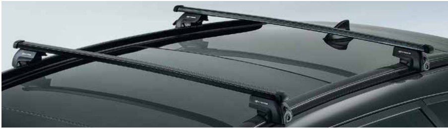
Relingquerträger, Stahl. Aus stabilem, hochwertigem Stahl, leicht zu montieren und zu demontieren. Für Fahrzeuge mit und ohne Panoramaschiebedach gleichermaßen geeignet. D7211-ADE00ST

Sorgfältig durchdachte und perfekt abgestimmte Komponenten verwandeln den Tucson in ein robustes Transportfahrzeug.