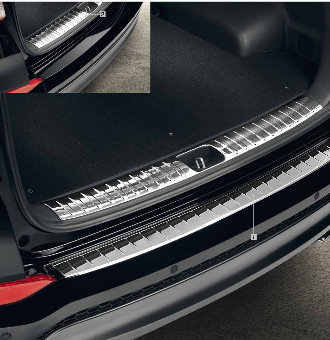
1 Ladekantenschutz, Edelstahl. Schützt den Bereich des Be- und Entladens am Kofferraum. D7274-ADE00ST 2 Ladekantenschutz, Edelstahl. Die hochwertige Edelstahlblende, hochglänzend, schützt die Innenkante der Ladefläche. D7274-ADE10STE1