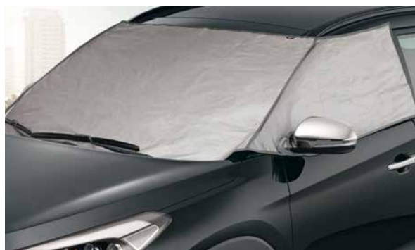
Eis- und Sonnenschutz. Schützt das Interieur bei starkem Sonnenschein vor extremer Wärmeentwicklung und die Windschutzscheibe sowie die vorderen Seitenfenster vor Eisbildung bei kaltem Winterwetter. D7723-ADE00