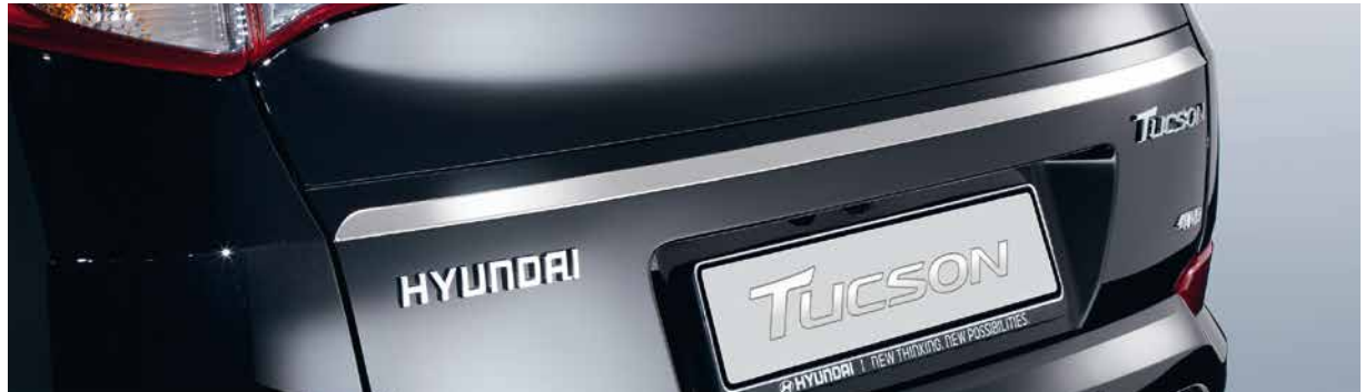
Zierleiste Heckklappe, Edelstahl. Die Zierleiste aus hochpoliertem Edelstahl ergänzt sich mit den anderen Gestaltungsdetails und verleiht der Heckklappe einen edlen Schliff. D7491-ADE00ST