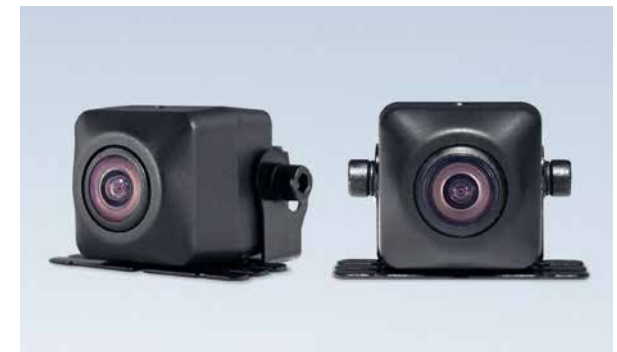
Rückfahrkamera. Optional für Zubehör 2 DIN Navigationssystem. 9999Z-30850