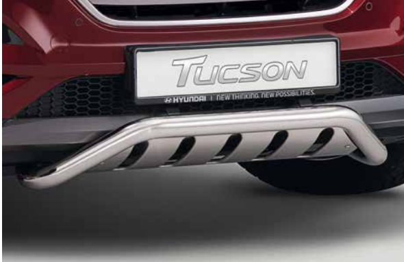
1 Anfahrschutz, vorne. Anfahrschutz vorne aus Edelstahl. 9999Z-050752

Unser Zubehör ist präzisionsgefertigt und im Hinblick auf Erscheinungsbild und Performance Ihres Tucson optimiert. Hochwertige Materialien und Liebe zum Detail sorgen dafür, dass es die strengen Fertigungsstandards für alle Hyundai Produkte erfüllt. Ihr Vertragspartner unterstützt Sie bei der Auswahl.