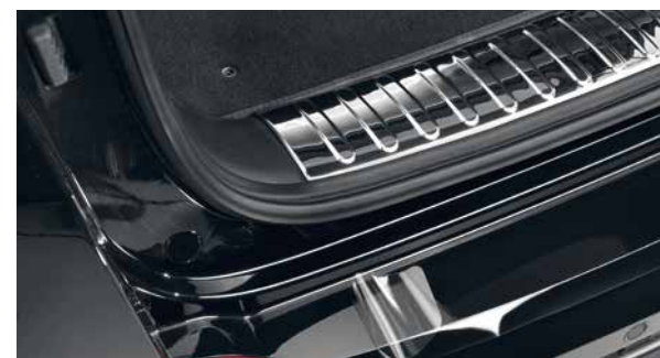
Ladekantenschutzfolie, transparent. Strapazierfähige, transparente Schutzfolie für die Oberfläche an der hinteren Stoßstange Ihres Autos. Verhindert Lackschäden beim Be- und Entladen. Selbstklebend. 9999Z-051004