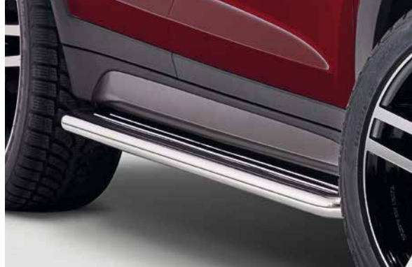
2 Trittbretter "robust". Robuste Trittbretter aus Edelstahl. Sind bei der Montage von Dachzubehör sehr nützlich und erleichtern den Einstieg in das Auto. Praktisch und funktional. Nicht in Verbindung mit Schmutzfängern. 9999Z-050753