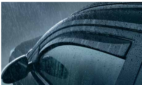
Seitenwindabweiser, vorne. Reduziert Verwirbelung beim Fahren mit leicht geöffnetem vorderem Fenster. Der aerodynamisch geformte Reflektor lenkt den Luftstrom um, weist Regentropfen ab und reduziert störende Windgeräusche. Set mit 2 Stück. D7221-ADE00