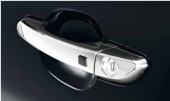
Schutzfolien für Türgriffmulde. Schützt die Lackierung vor Fingernagel- und Schlüsselkratzern und sorgt so dafür, dass sie immer frisch und neu wirkt. Aus beständiger, selbstklebender transparenter Folie. Set mit 4 Stück. 9999Z-050999