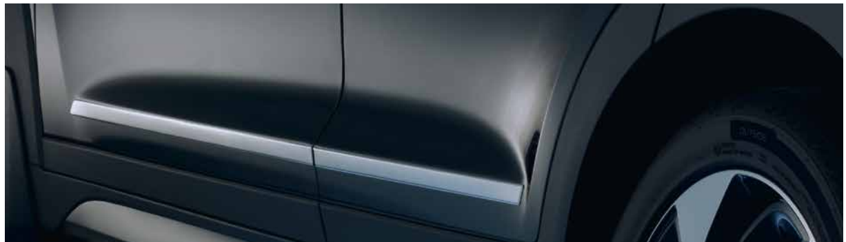
Zierleiste seitlich, Edelstahl. Sorgt für sportlichen Pfiff am unteren Türabschluss. Aus hochpoliertem Edelstahl. Absolut wetterfest. D7271-ADE00ST