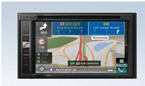
2 DIN Navigationssystem. DVD Mediacenter inkl. Navigation und Bluetooth für Fahrzeuge ohne werksseitig verbautes Navigationssystem. Komplettpaket mit Navigationsgerät, Blende und Adapterkabel. ▲ 9999Z-30441 ◀ 9999Z-30180