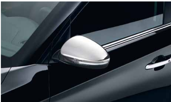
Spiegelblenden. Die auffälligen Spiegelabdeckungen aus hochpoliertem Edelstahl harmonieren perfekt mit anderen Extras - für einen stilvollen Premium-Look. Für Fahrzeuge mit integrierten Blinkern. 2 Stück. D7431-ADE00STE1