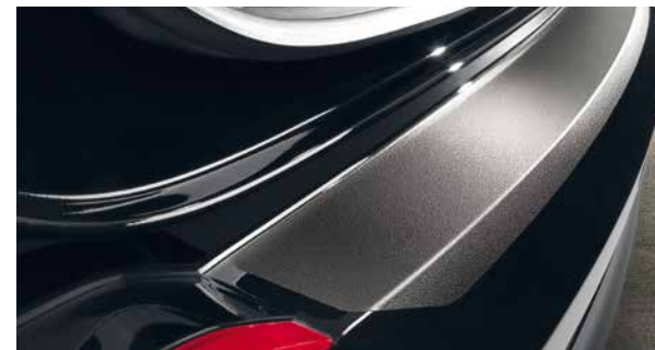
Ladekantenschutzfolie, schwarz. Maßgefertigte schwarze Schutzfolie für die Oberfläche an der hinteren Stoßstange Ihres Autos. Verhindert Lackschäden beim Be- und Entladen. Selbstklebend. 9999Z-051003