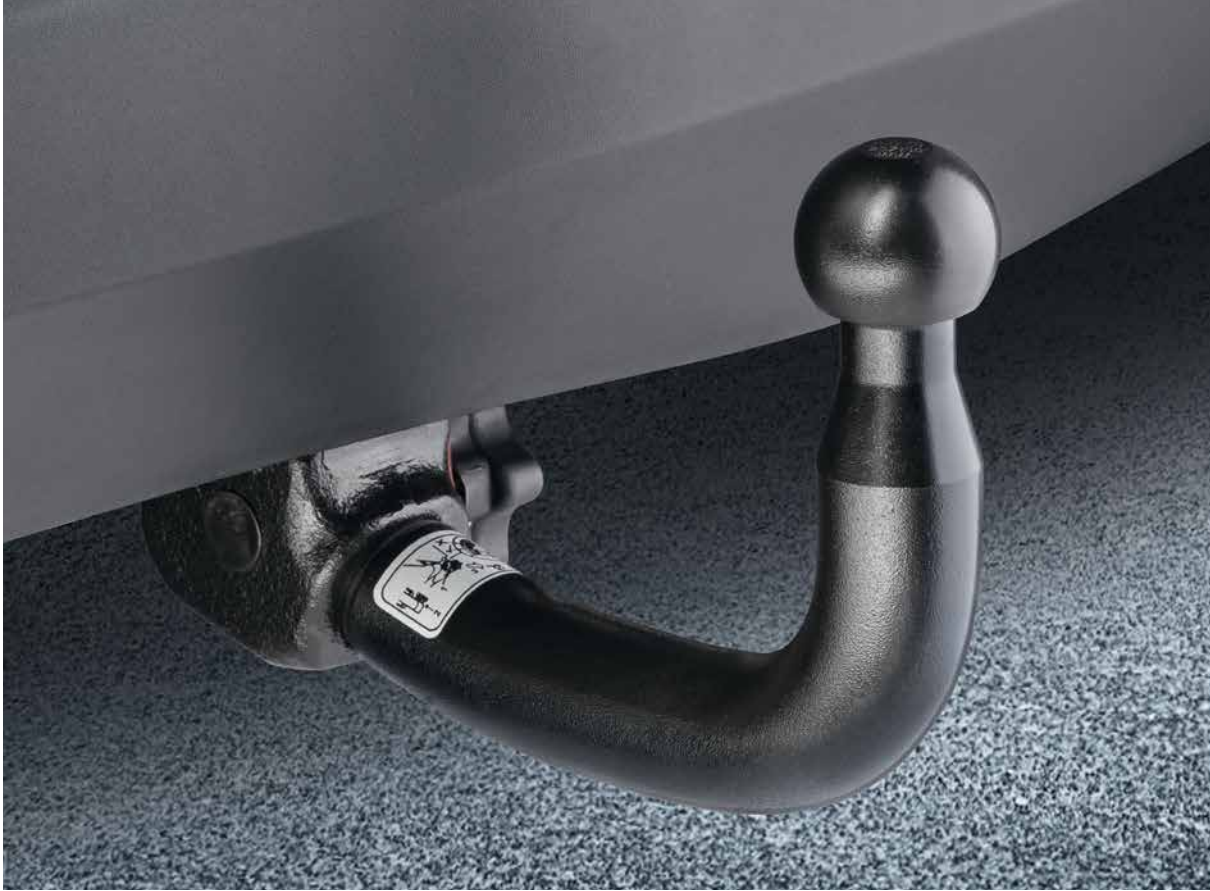
Anhängerzugvorrichtung. Kabelsatz 13-polig, inkl. Montagesatz, E-Prüfnummer. LED-Kompatibel (für Anhänger und Zugfahrzeug); starr, inkl. E-Satz 9999Z-040528; abnehmbar, inkl. E-Satz 9999Z-040529; schwenkbar, inkl. E-Satz 9999Z-040530.

1 AHK Fahrradträger, klappbar. Heckfahrradträger für Anhängervorrichtung. Komfortable, abschließbare Heckfahrradträger für den sicheren Transport von 2 Fahrrädern. Kinderleichte Montage auf der Anhängervorrichtung und ebenso einfache Befestigung Ihrer Fahrräder auf den Trägern. Dank cleverer Abrollmechanik kann der Kofferraum weiterhin geöffnet werden. Zur platzsparenden Lagerung im Kofferraum oder zu Hause lässt sich der Träger bequem zusammenklappen. Doppelter Diebstahlschutz (Fahrräder und AHK-Träger sind gesichert). Auch für E-Bikes geeignet. 9999Z-04625