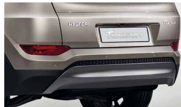
Designblende, Heck. Mit der am Heck angebrachten Designblende sieht Ihr Tucson sportlich und raffiniert aus. Das Gesamtdesign des Autos wird durch diese Stilergänzung perfekt abgerundet. Für Fahrzeuge ohne sichtbares Endrohr. 9999Z-05427