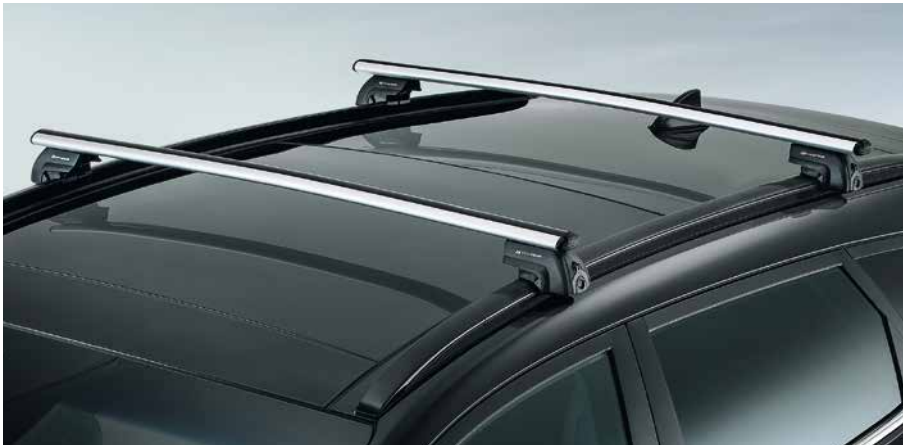
Relingquerträger, Aluminium. Die Traversen aus leichtem, robustem Aluminium sind perfekt auf die Dachreling des Tucson abgestimmt, so dass sie sich leicht montieren und demontieren lassen. Für Fahrzeuge mit und ohne Panoramaschiebedach gleichermaßen geeignet. D7211-ADE00AL