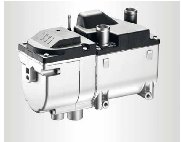
Hydronic 2 Economy. Durchschnittsverbrauch für eine 30-minütige Heizphase bei Diesel-Modellen: 5KW Heizleistung verbraucht 0,22l.